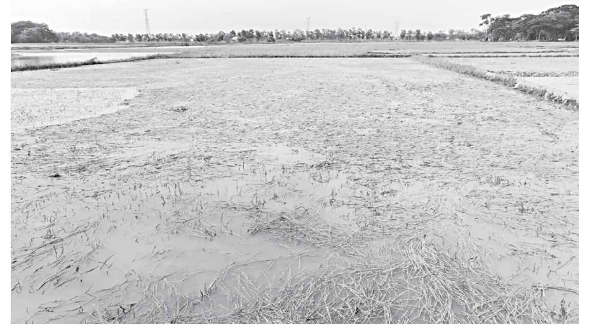
A damaged Aman seedbed in Auliapur village of Sadar upazila in Patuakhali.

According to Patuakhali DAE, seedbeds were made on about 25,000 hectares of land, setting Aman cultivation target on about two lakh hectares in the district.