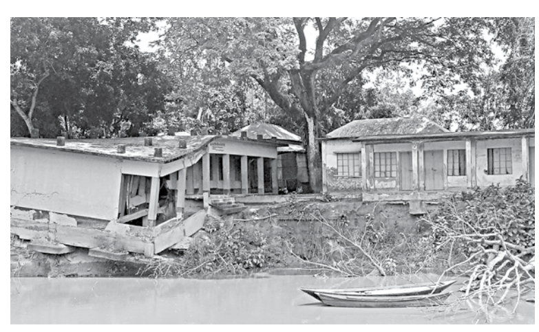
This building of Sarotia Gazi Government Primary School in Tangail's Nagarpur upazila is on the verge of collapse, leaving academic activities of nearly 150 students uncertain.

Moreover, students of the institution have been deprived coronavirus, they added.