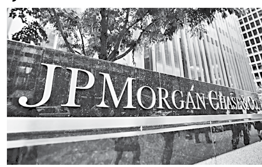
A view of the exterior of the JP Morgan Chase & Co corporate headquarters in New York City, US.

testing at least twice a week, according to the memo.