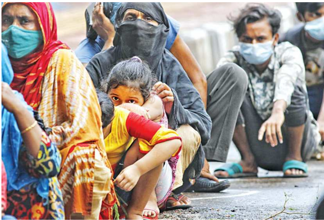
People who lost their livelihood due to the lockdown wait for food near Ramna Police Station in the capital. Officers at the police station said they have been handing out packs of food to almost 1,000 people every day since the lockdown began.