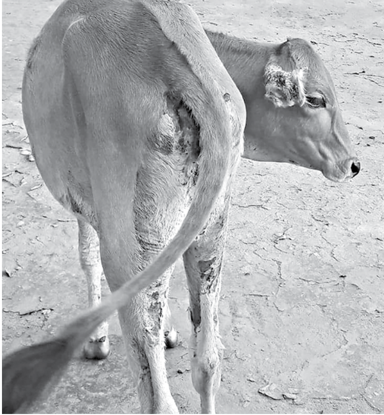
A cow infected with dermatitis in Lalmonirhat Sadar upazila.

Asked, Chilmari Upazila Livestock Officer Rashedul Islam said dermatitis or 'skin rot' disease has been in the