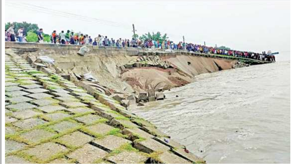
A section of the Sirajganj town protection embankment that was eroded by the Jamuna on Tuesday at Sirajganj jail gate near Hard Point area of the embankment.

While the townspeople speculated disastrous consequences in case the levee breaks, BWDB officials assured that the erosion of the levee will be brought under control once their work is complete.