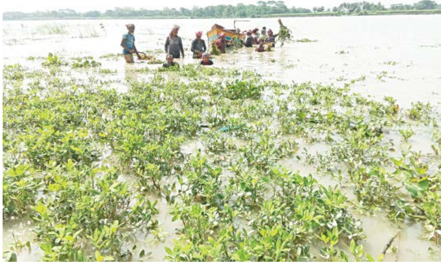
Farmers try to salvage their peanut harvest in a village of Alfadanga upazila of Faridpur after the Madhumati burst its banks and flooded the field a few days ago.