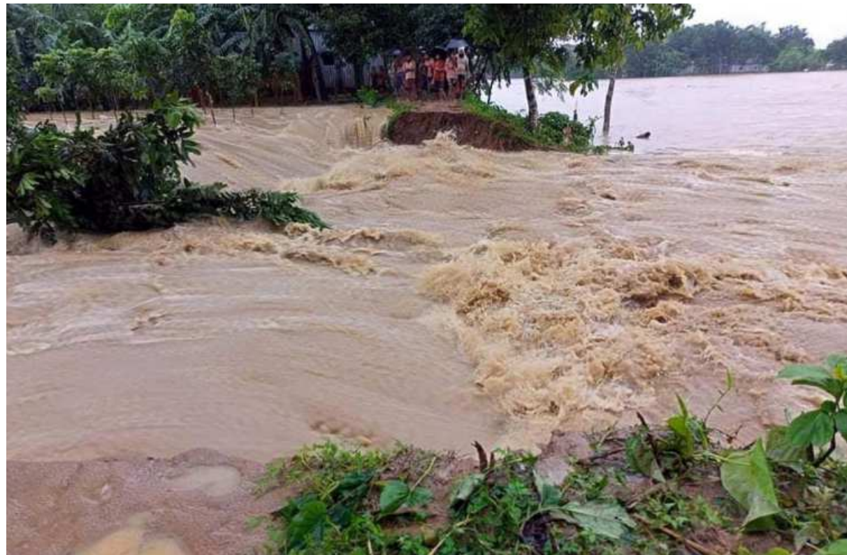
Hundreds of families in low-lying areas of Dhobaura upazila in Mymensingh have been marooned following flash floods. In the photo, water is seen gushing in after breaching a dam at Gamaritola union of the upazila yesterday.