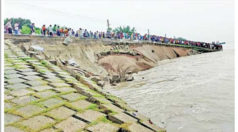
A section of the Sirajganj town protection embankment that was eroded by the Jamuna on Tuesday at Sirajganj jail gate near Hard Point area of the embankment.

While the townspeople speculated disastrous consequences in case the levee breaks, BWDB officials assured that the erosion of the levee will be brought under control once their work is complete.