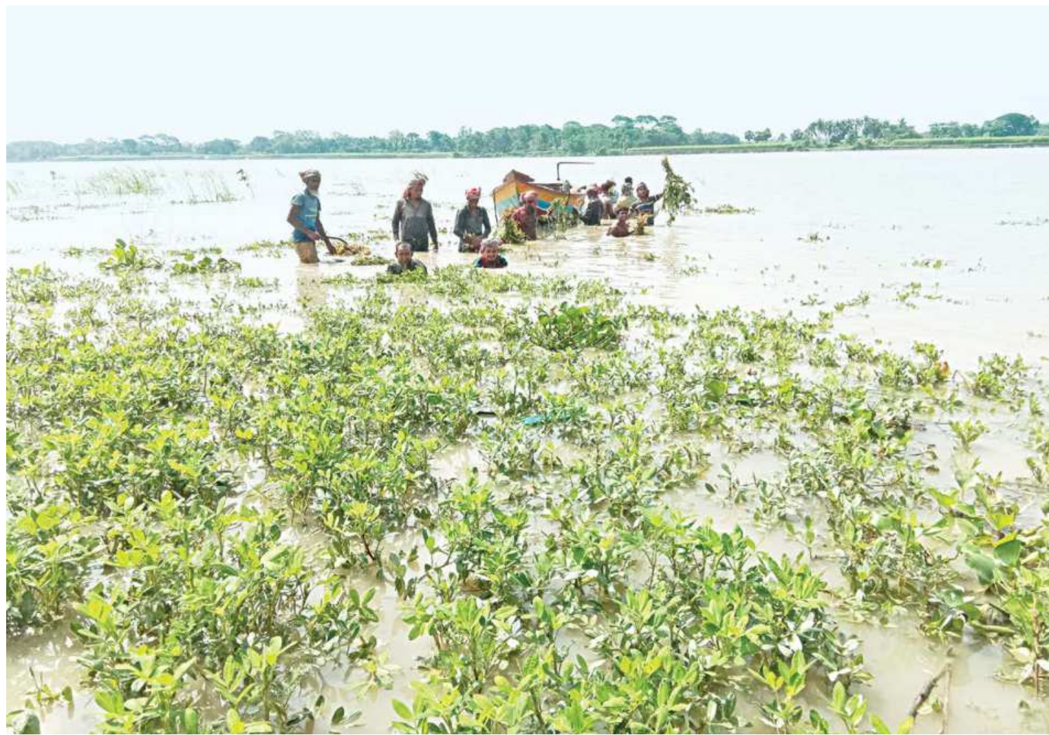
Farmers try to salvage their peanut harvest in a village of Alfadanga upazila of Faridpur after the Madhumati burst its banks and flooded the field a few days ago.