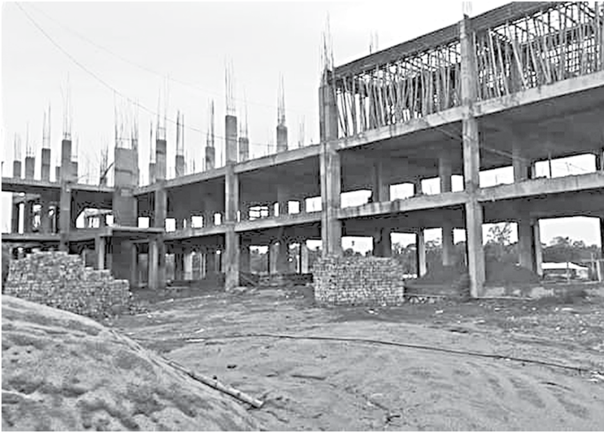
One of the two under-construction buildings of Taimush Ali Technical School and College in Bhabanipur area of Juri upazila in Moulvibazar. The contractor has been found to be using below par rod in the construction of both buildings of the institution.

They informed their higher authorities of the anomaly and await instruction for further action to this effect, he added.