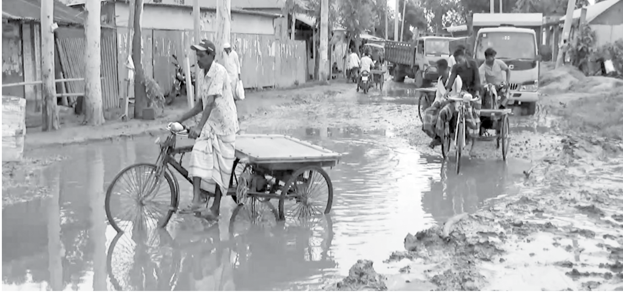
The damaged stretch on Madhupur road from Sagardighi in Tangail's Ghatail upazila.