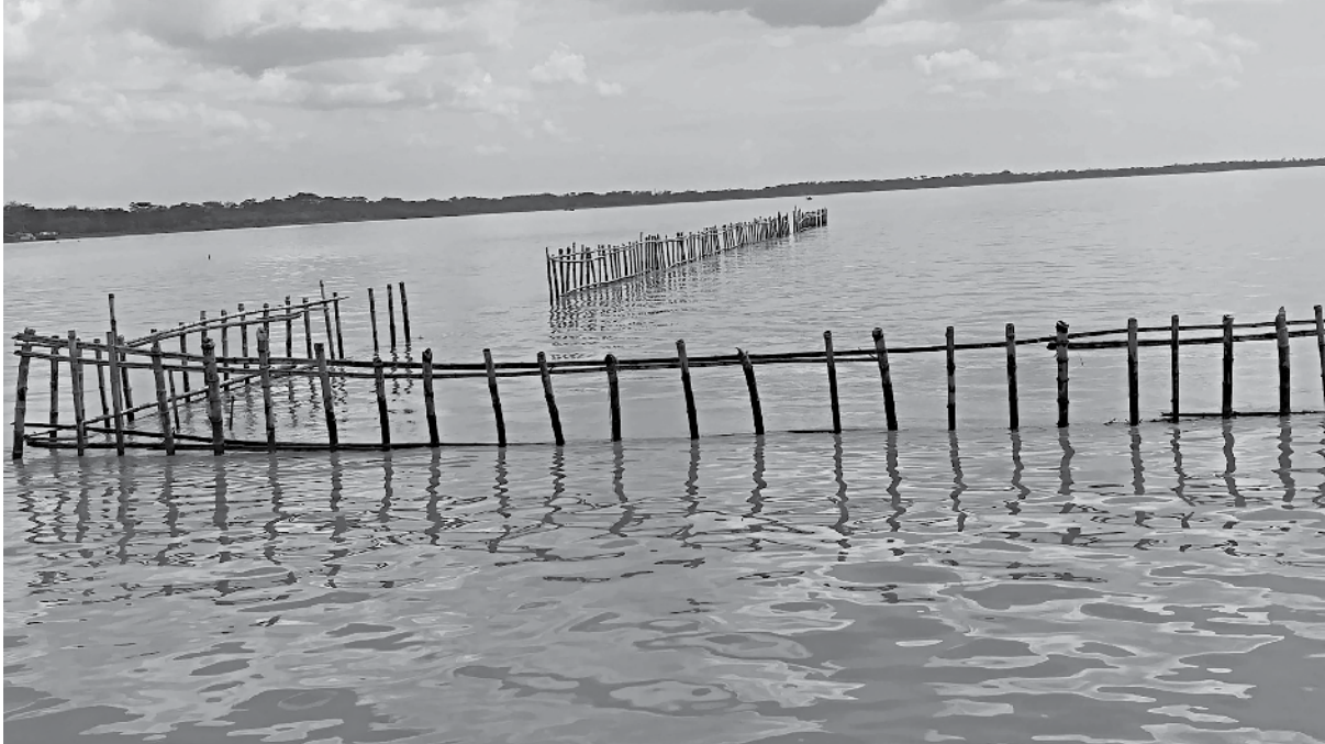
Bamboo fence in Barguna's Amtali ferry ghat area disrupts movement of vessels.