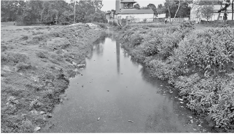
The present condition of Bamondanga river after partial recovery by BWDB. The photo was taken in Sarkerpara area of Nilphamari municipality recently.