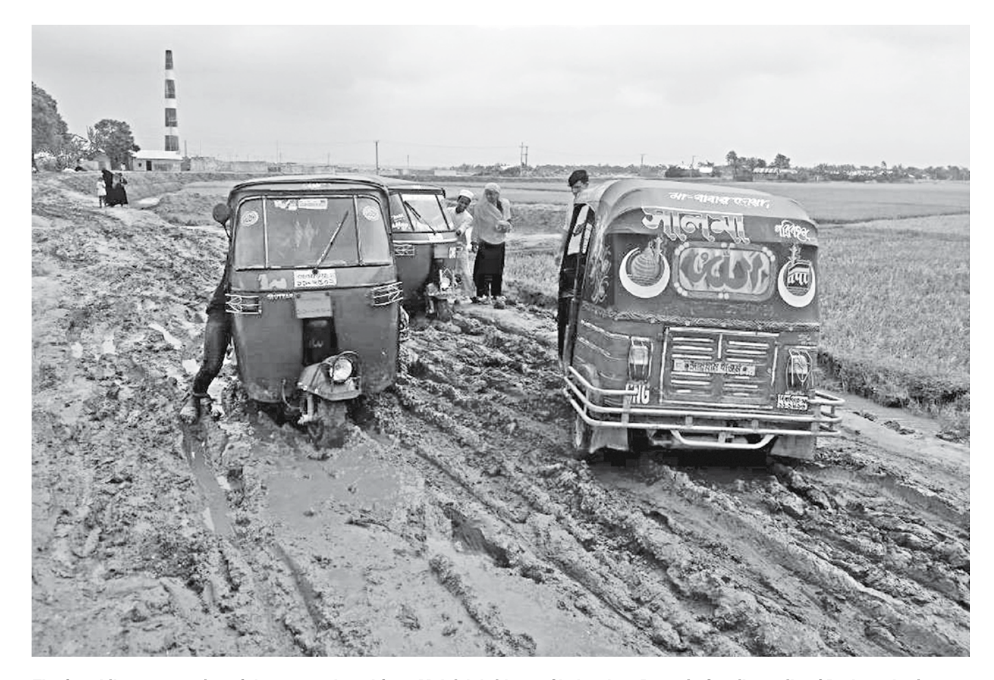
The four-kilometre section of the unpaved road from Molaish bridge to Shahzadpur Bazar in Sarail upazila of Brahmanbaria becomes unusable for days after one day's rain. The photo was taken a few days ago.