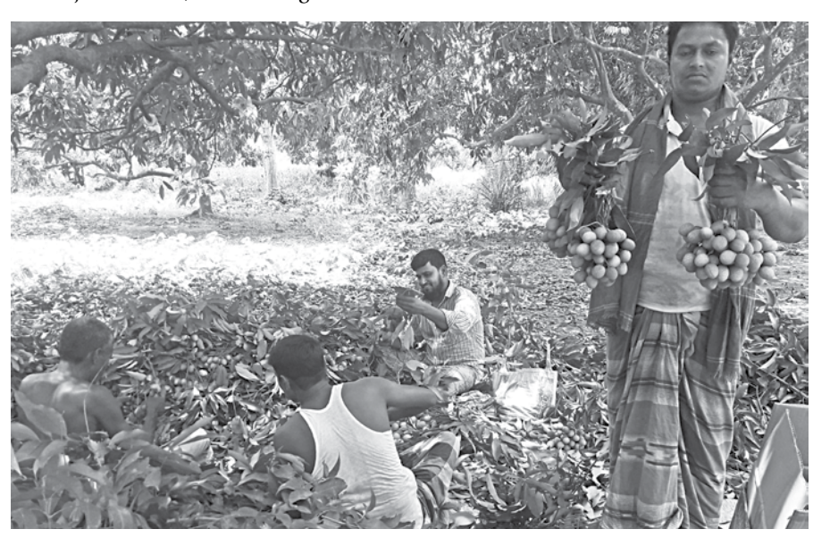
Growers at a litchi orchard in Magura Sadar upazila all smiles over fair prices of the juicy fruit.

He also said that the cost of harvesting