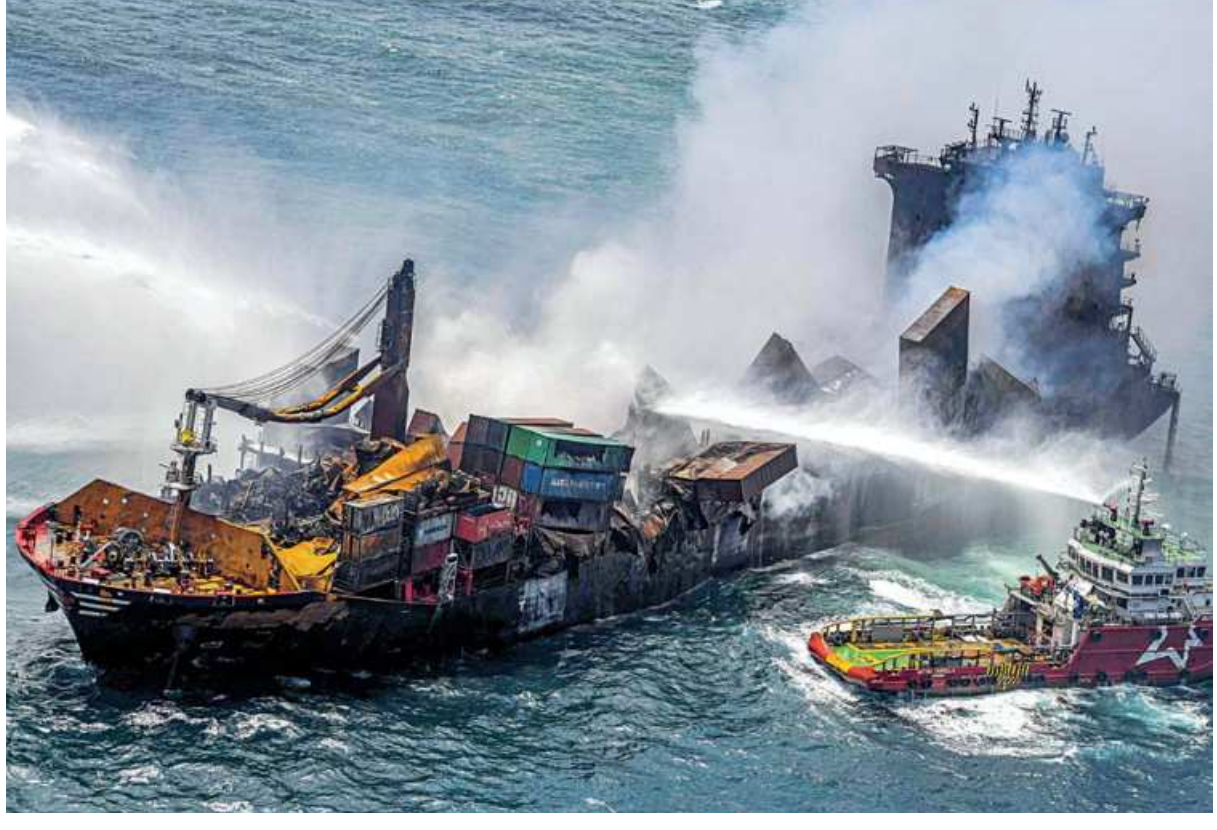
This handout photograph taken and released by the Sri Lanka Air Force yesterday shows smoke billowing from the Singapore-registered container ship MV X-Press Pearl, which has been burning for the eleventh consecutive day as vessels try to douse off the fire, in the sea off Sri Lanka's Colombo Harbour, in Colombo. Sri Lanka yesterday sued the owner of the ship for the environment pollution it caused.

If Lapid, 57, fails to announce a government by Wednesday, a new election is likely.