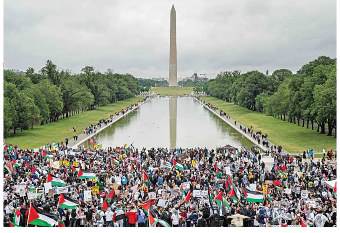
Supporters of Palestine hold a rally at the Lincoln Memorial in Washington, DC, US on Saturday. More than 1,000 rallied Saturday in Washington in support of Palestinians and calling for an end to US aid to Israel.

Putin, merged into one. Seagal, a Russian citizen since 2016, proposed a crackdown on businesses which damage the environment. The party controls a faction in the lower house of the Russian parliament and plans to take part in a parliamentary election in September. Seagal, a US-born martial artist, is best known for producing and starring in action movies, while Putin, who granted him the citizenship, is a fan of martial arts.