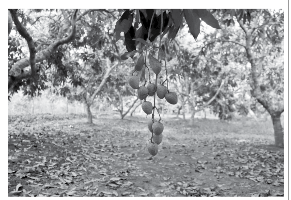
A litchi orchard in Pirojpur's Nazirpur upazila.

"But this year, the farmers have got the lowest yield due to unfavourable