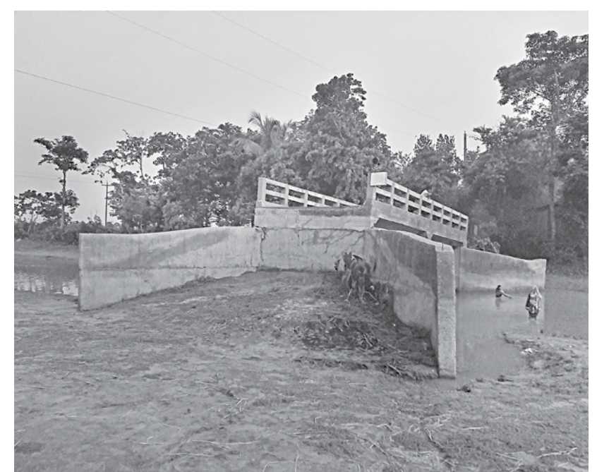
The Tk 28-lakh bridge lying useless without any road for over five years, near Uttarhati village in Ajmeriganj upazila of Habiganj.

In reality, an existing road nearby has been serving