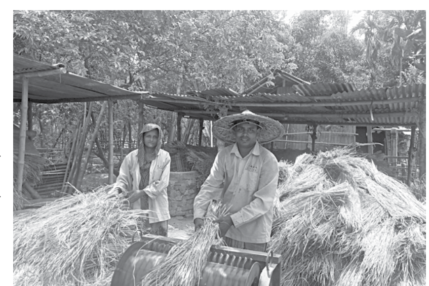
The nature has been bountiful to Aman farmers in Jhenidah where good prices of the paddy are helping create a festive atmosphere in the district this time around. The photo of two workers threshing paddy was taken from Solaimanpur village in Kotchandpur upazila recently.

farmers planted Boro Aman on an extended area this season, said many of them.