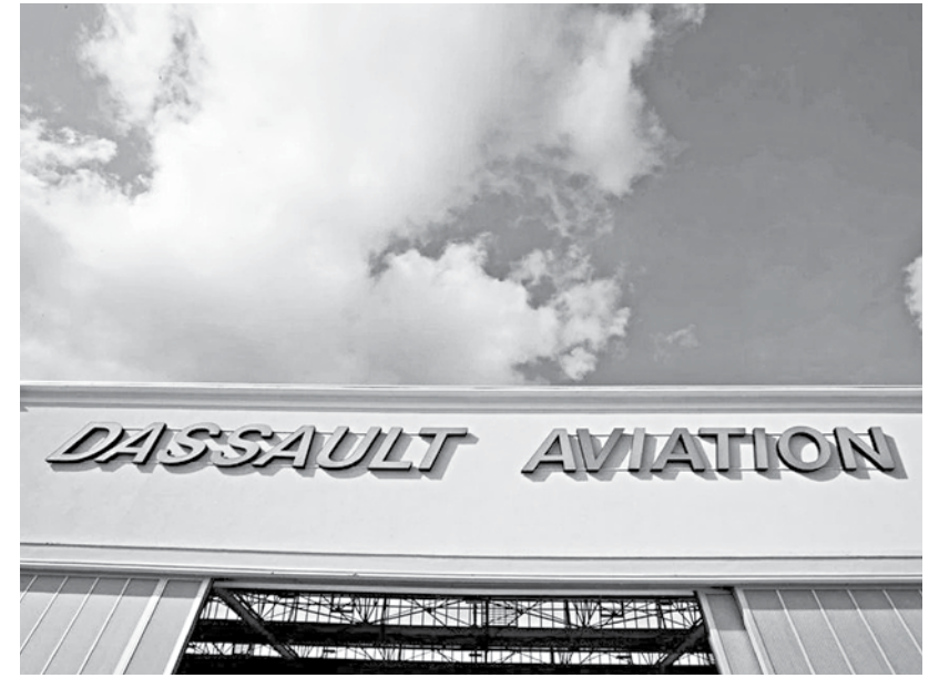
The logo of French aircraft manufacturer Dassault Aviation is seen on a hangar in Merignac near Bordeaux, France.

REUTERS, Paris France, Germany and Spain said on Monday they had reached a deal over the next steps of the development of a new fighter jet, Europe's largest defence project at an estimated cost of more than 100b euros ($121.4b). France in particular has billed the combat jet project -- which includes a next-generation manned and unmanned aircraft -- as crucial for Europe to strengthen its defence autonomy and face competition from China, Russia and the United States.