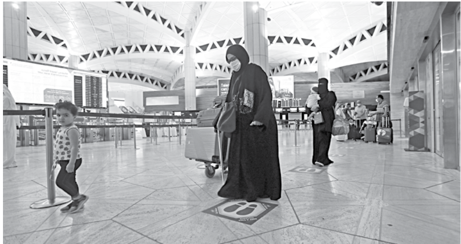
A Saudi woman wearing a face mask and keeping social distance waits for her turn to check-in her baggages at the King Khalid International Airport, as Saudi authorities lifted the travel ban on its citizens after fourteen months due to coronavirus disease restrictions, in Riyadh, Saudi Arabia.

Authority (STA). STA Chief Executive Fahd Hamidaddin told Reuters the kingdom would reopen to foreign tourists this year with an announcement expected to be made "very soon." Hamidaddin declined to say exactly when. Saudi Arabia liberalised its tourism industry in 2019, making it easier for foreigners to apply for tourist visas to the kingdom that had been relatively closed off for decades. Hamidaddin said the kingdom was still targeting 100m annual visits by 2030, up from about 40m a year before the pandemic. It was also still targeting for tourism to account for 10 per cent of GDP, up from 3 per cent, by 2030, he said.