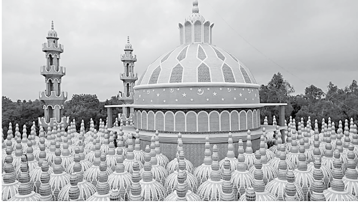
The under-construction 201-domed mosque in Tangail's Gopalpur upazila.