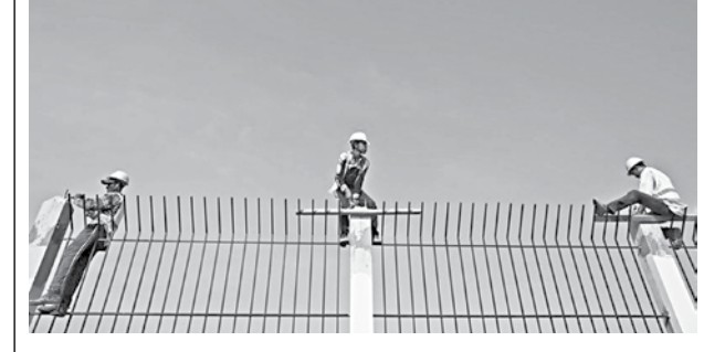
People work at the site of the Thilawa Special Economic Zone (SEZ) project in Thilawa.

Myanmar's military rulers have approved new investment in projects worth nearly $2.8b, including a liquefied natural gas (LNG) power plant that will cost $2.5b, the country's investment body said.