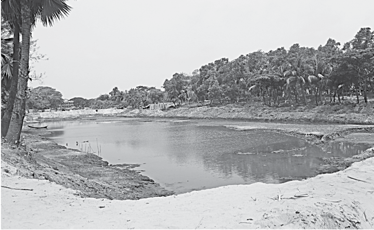
Kuakata municipality authority digs lake risking the nearby 53-year-old flood control dyke. The photo was taken recently.