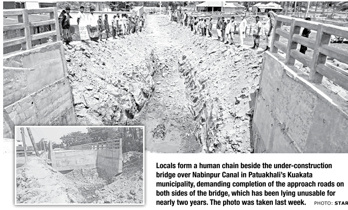
Locals form a human chain beside the under-construction bridge over Nabinpur Canal in Patuakhali's Kuakata municipality, demanding completion of the approach roads on both sides of the bridge, which has been lying unusable for nearly two years. The photo was taken last week.