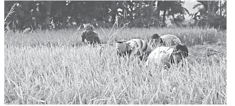
Farmers busy harvesting Boro paddy in a field at Jujkhola village of Pirojpur Sadar upazila. The photo was taken recently.

The government has set a target of buying 4,260 tonnes of paddy, at Tk 27 per kilogram, between April 28 and August 16 this year, as per a notice issued by the food ministry.