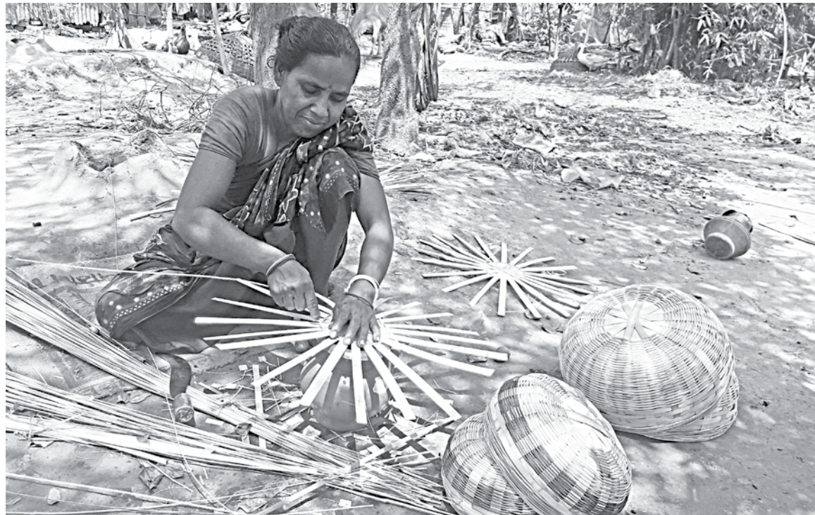
A member of Bed community, in Kayargachhi Abashan Prokolpo of Jhenidah Sadar upazila, making household accessories with bamboo.