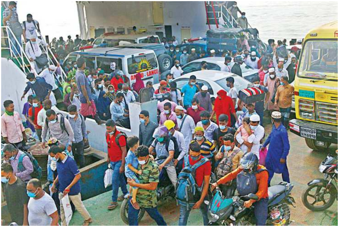
A ferry reaches Shimulia in Munshiganj from Banglabazar in Madaripur yesterday morning. As the government declared that shops and malls can be opened from yesterday, amid the ongoing restrictions on movement, people, many of whom are traders and their employees, started returning to the capital.

hundreds of oxygen concentrators and ventilators, is now on its way from the UK to India to support efforts to prevent the tragic loss of life from this terrible virus," Prime Minister Boris Johnson said in a statement. German Chancellor Angela Merkel said earlier yesterday her government was preparing emergency aid for India. The vast nation of 1.3 billion people recorded 349,691 fresh infections and 2,767 deaths yesterday -- the highest since the start of the pandemic. Hospitals in Delhi and across the country are turning away patients after running out of medical oxygen and beds. "We were confident, our spirits were up after successfully tackling the first wave, but this storm has shaken the nation," Modi said in a radio address. His government has faced criticism that it