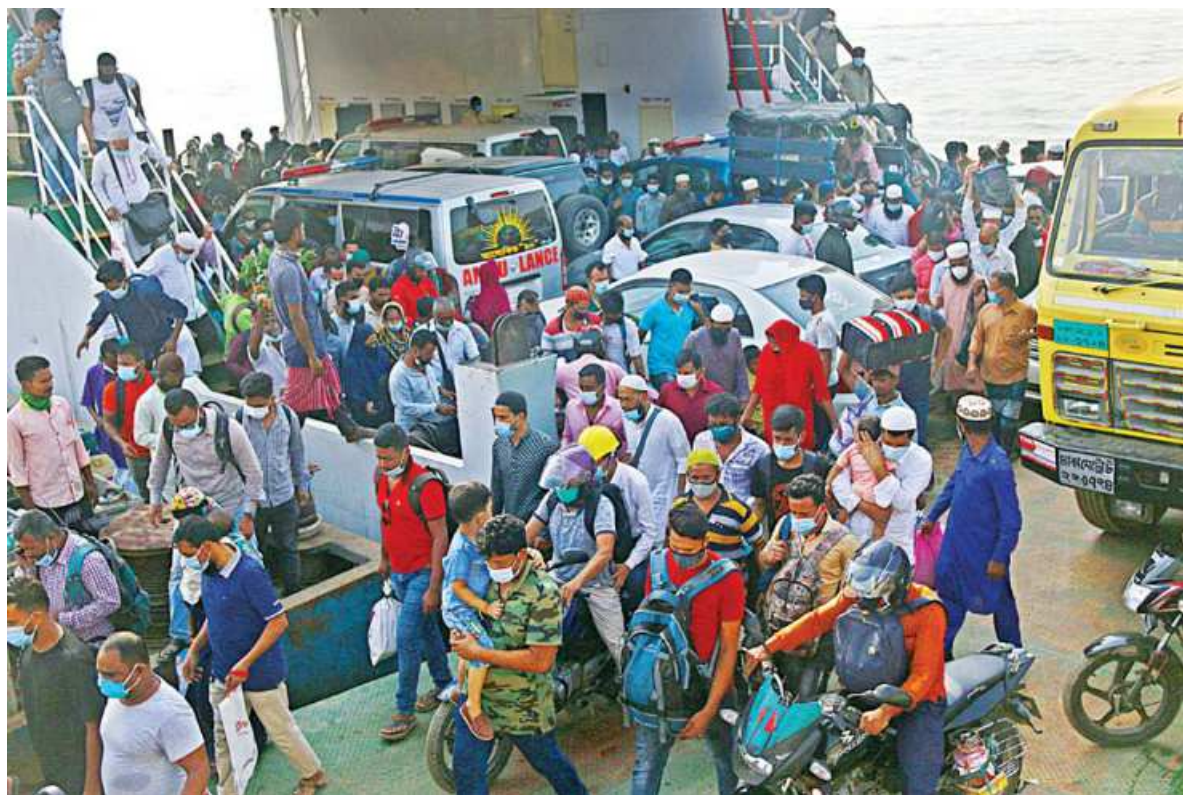
A ferry reaches Shimulia in Munshiganj from Banglabazar in Madaripur yesterday morning. As the government declared that shops and malls can be opened from yesterday, amid the ongoing restrictions on movement, people, many of whom are traders and their employees, started returning to the capital.