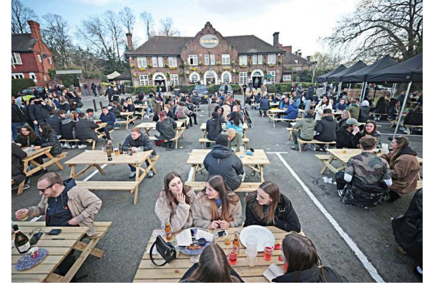
People enjoy their drinks at The Fox on the Hill pub after its reopening, as the coronavirus disease restrictions ease, in London, Britain, yesterday. Crowds queued up outside shops, pubs started selling pints at midnight and hairdressers welcomed desperate customers as England started to reopen its economy after three months of lockdown.