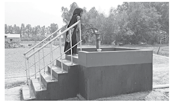
The ultra-poor families of four villages in Tangail Sadar upazila have been provided with tube wells on elevated basement under the IFRC project.