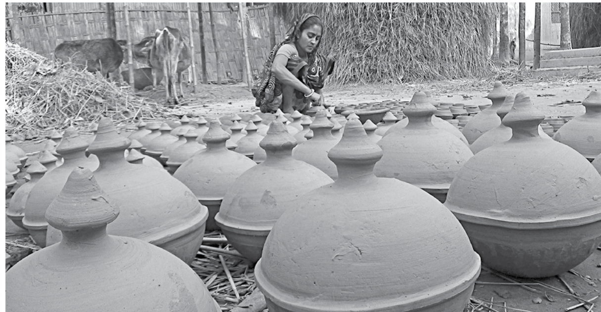
A potter at work in Kumarpara village of Lalmonirhat's Aditmari upazila. Over two thousand families of potters in Lalmonirhat and Kurigram have been living from hand to mouth for about a year, when pottery sales plummeted due to restrictions imposed on holding large gatherings to curb the spread of Covid-19 pandemic. Their livelihood depend on sales of various pottery, clay figurines and animals, especially during fairs and carnivals organised on the occasions of the Bangla new year and different Hindu festivities in the months of Chaitra and Baishakh under the Bangla calendar. But the cases of coronavirus infections rising in March have given them reason to believe that they may not see the return of their investment in new potteries this year and their last year's losses will not be recovered either.

"However, many other such helpless families remain in other villages of the union and they also need such aid," he said.