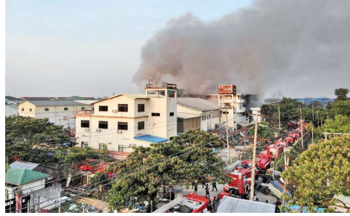
General view of a fire at JOC Galaxy Apparel Co in Hlaing Thar Yar township, Yangon, Myanmar yesterday. The Chinese-owned factory was set on fire by anti-coup activists. Myanmar troops fired at anti-coup protesters yesterday, killing at least 13 people and wounding several, media said, as a series of small blasts hit the commercial capital Yangon.