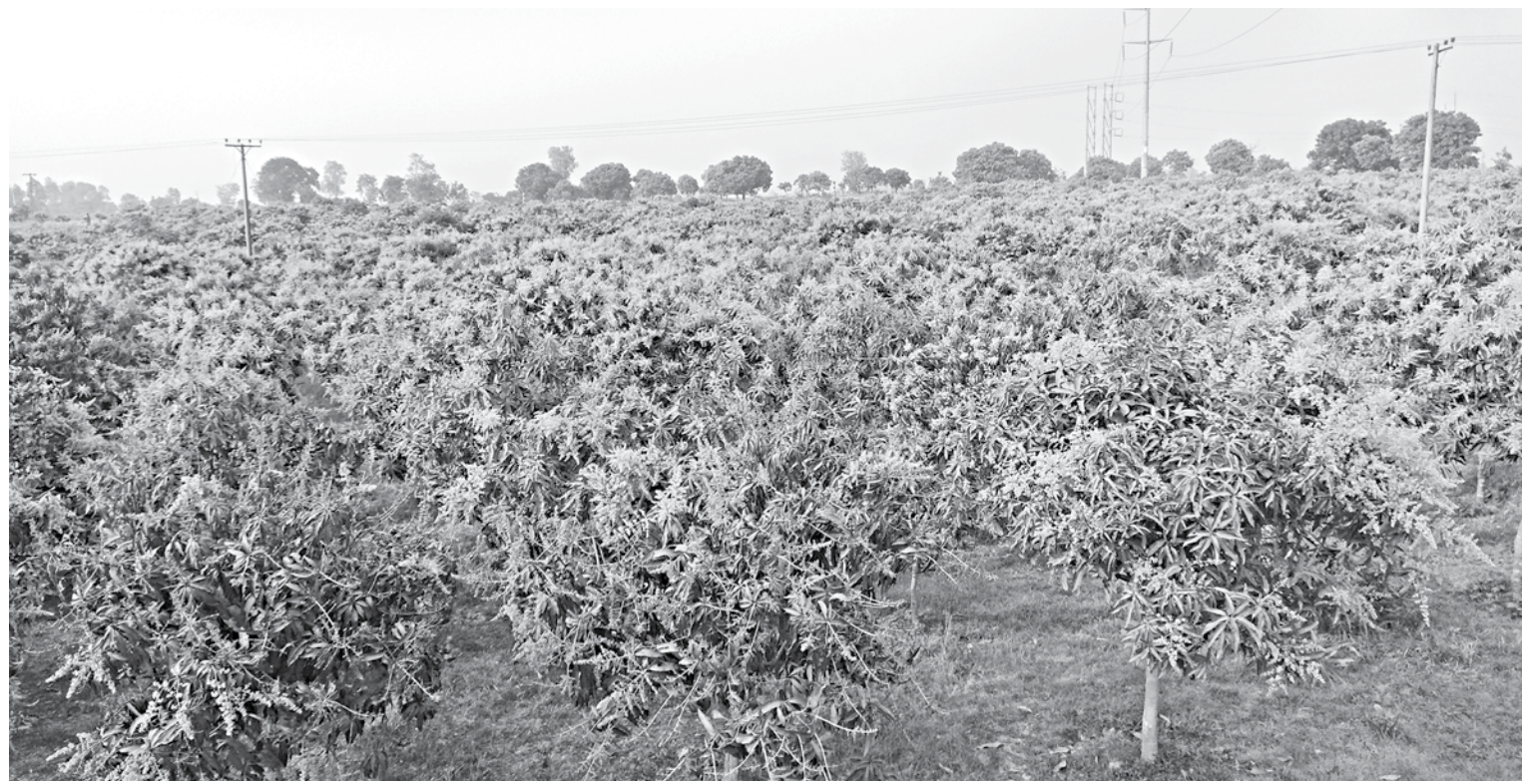
An orchard of hybrid variety mango trees in Dheenagar village of Chapainawabganj Sadar upazila.