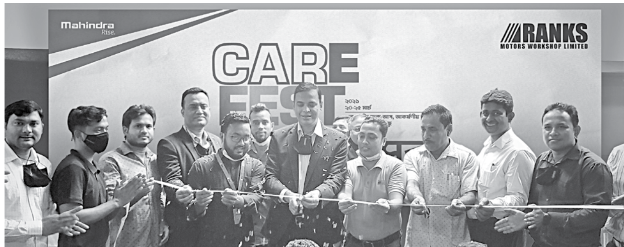
Ranks Motors Workshop, a subsidiary of Ranks Group, has organised a "Ranks Mahindra Care Fest Service Campaign 2021" jointly with Mahindra & Mahindra from March 20 which ends today.