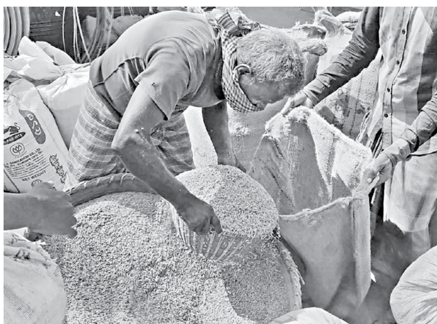
Farmers selling paddy at a local market in Moulvibazar's Srimangal upazila.

"If we don't give bribe, government officials will come up with one after another excuse like moisture content or higher percentage of chitta. And workers also have to be paid for loading and