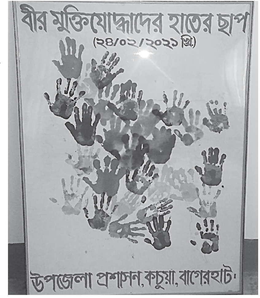
The map of Bangladesh with handprints of living freedom fighters from Bagerhat's Kachua upazila.