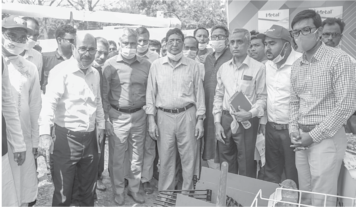
Muhammad Abdur Razzaque, agriculture minister, visits a stall of METAL, a maker of agriculture machinery, at an “Agri-Machinery Exhibition” organised by the Bangladesh Wheat and Maize Research Institute in Dinajpur recently.