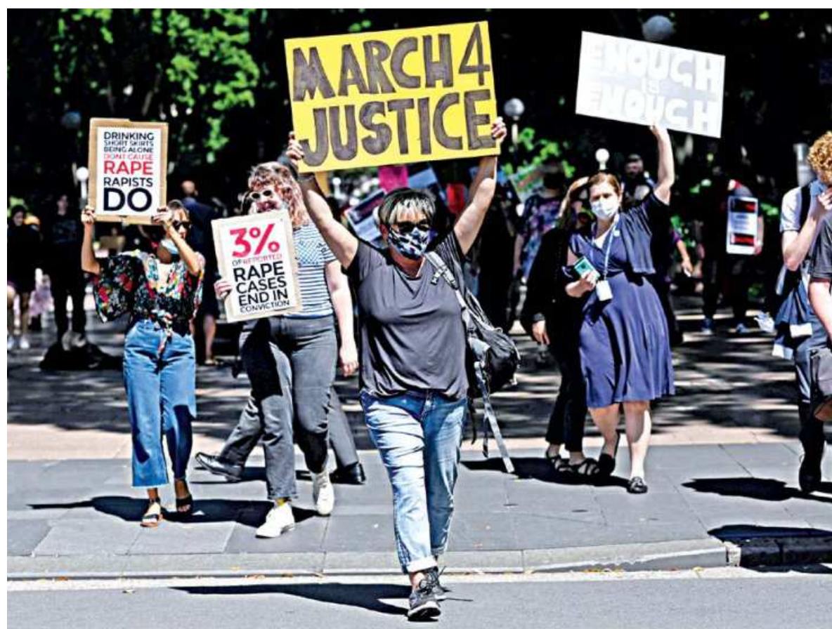
Protesters rally in response to the treatment of women in politics following several sexual assault allegations, as part of the Women's March 4 Justice rally in Sydney, Australia yesterday.

Taiwanese firms in Southeast Asia have been confused for Chinese ones in protests before, including in 2014 when thousands of Vietnamese set fire to foreign factories in an angry reaction to Chinese oil drilling in a part of the South China Sea claimed by Vietnam.