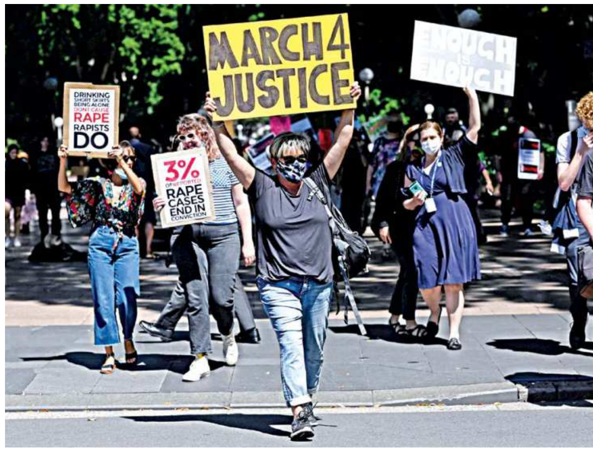
Protesters rally in response to the treatment of women in politics following several sexual assault allegations, as part of the Women's March 4 Justice rally in Sydney, Australia yesterday.

Taiwanese firms in Southeast Asia have been confused for Chinese ones in protests before, including in 2014 when thousands of Vietnamese set fire to foreign factories in an angry reaction to Chinese oil drilling in a part of the South China Sea claimed by Vietnam.