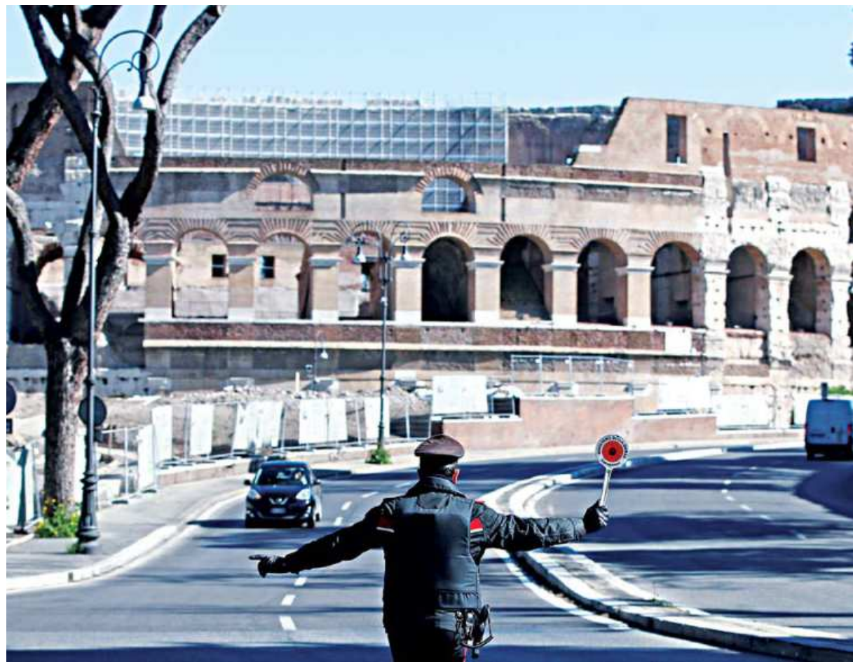
An Italian Carabinieri officer stops a car to check the documents of a driver as Rome becomes a 'red zone', going into lockdown, as the country struggles to reduce the coronavirus disease infections, in Rome, Italy yesterday.

"In Afghanistan today the Ministry of Education suffocated the voices of our little girls by making it illegal for them to sing," tweeted Shamila Kohestani, former captain of the national women's football team.