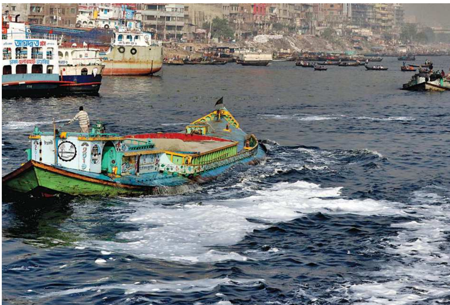
The Buriganga in Dhaka's Keraniganj area is so polluted that vessels plying the murky waters of the river leave a trail of foam. The stench of the water is also unbearable. The photo was taken a couple of days ago.