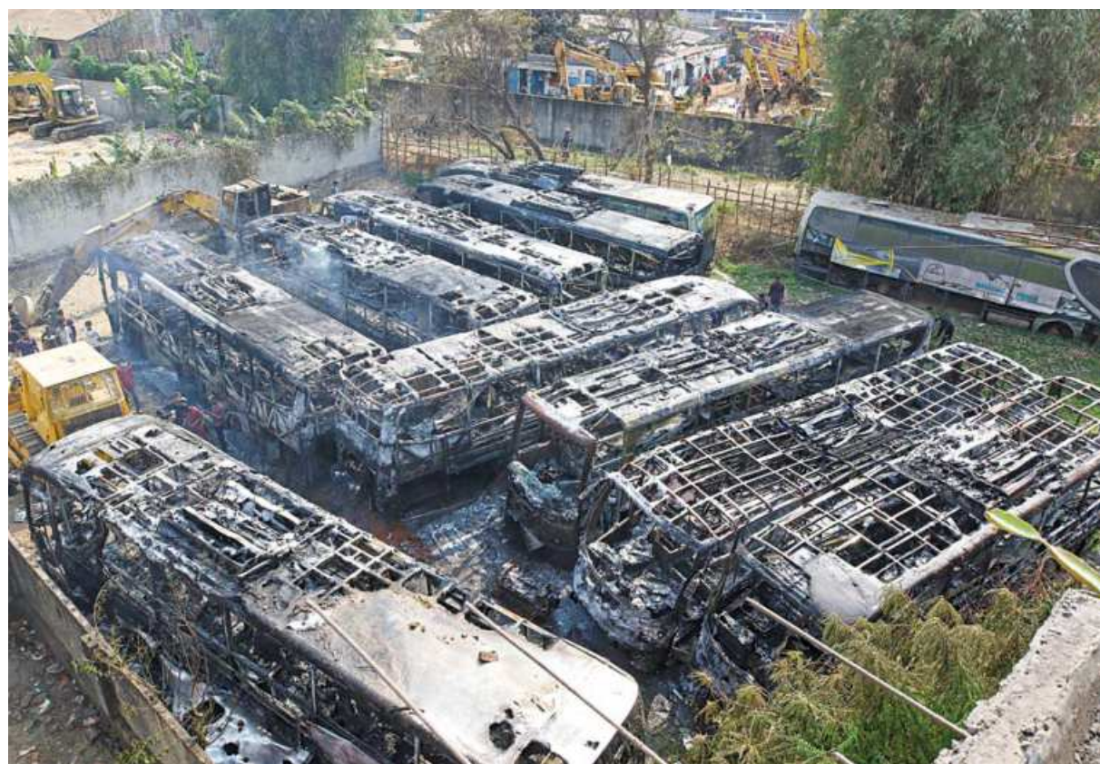
Charred remains of intercity luxury buses at a depot in Colonel Hat area of Chattogram city. Fire service officials said a fire gutted nine not-in-service buses of Bagdad Paribahan there. They also said they were working to ascertain the cause of the fire, which broke out around 1:15pm yesterday.