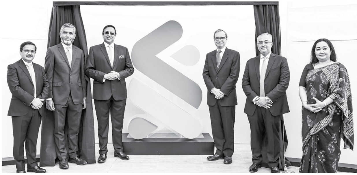
STANDARD CHARTERED BANGLADESH British High Commissioner to Bangladesh Robert Chatterton Dickson unveils Standard Chartered Bangladesh's new branding elements, including a logo, at the bank's Bangladesh headquarters in Dhaka yesterday.