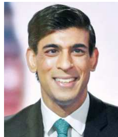
Britain's Chancellor of the Exchequer Rishi Sunak

Britain is the worst-hit country in Europe with more than 120,000 Covid deaths and four million cases but its economic recovery hopes have been boosted by its vaccination of millions of adults.