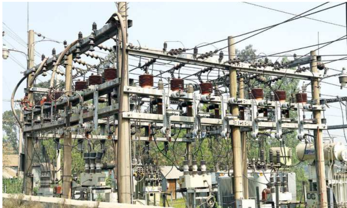
SK ENAMUL HUQ

The local government division got the highest raise, of Tk 3,038.87 crore, taking its total from Tk 31,131.32 crore in the original ADP to Tk 34,170.19 crore. It was to give