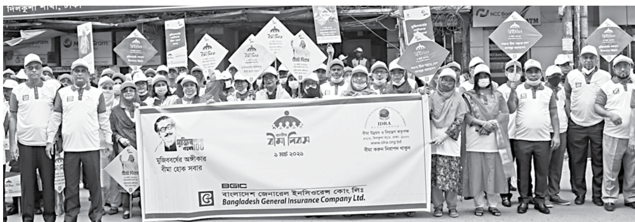
Officials and employees of Bangladesh General Insurance Company participate in a rally in the capital's Motijheel yesterday marking National Insurance Day.