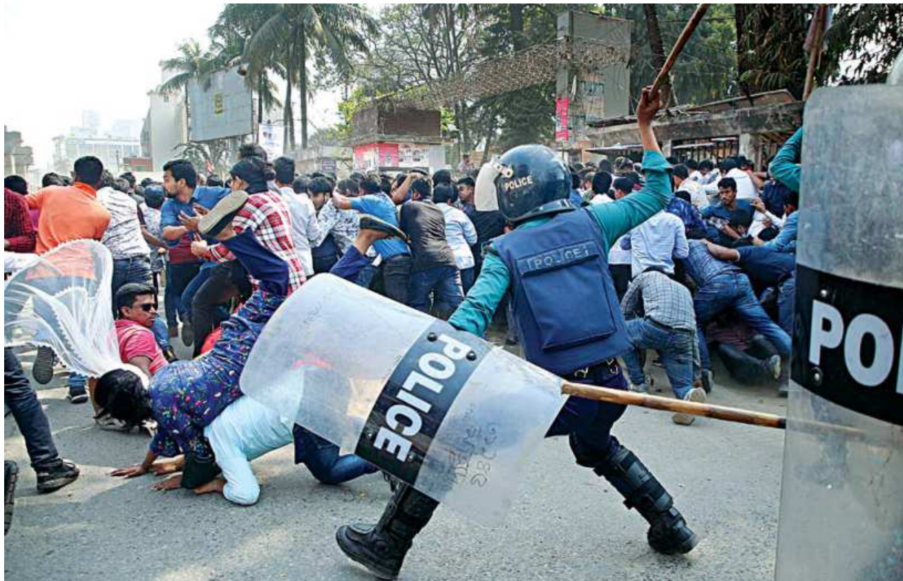
Police swoop on activists of Jatiyatobadi Chhatra Dal, a pro-BNP student body, in front of the Jatiya Press Club in the capital yesterday morning. At least 40 people, including some policemen, were injured in the clash that took place around 11:00am.

WE'VE TO SUSTAIN THE RECOGNITION: PM - PAGE 2