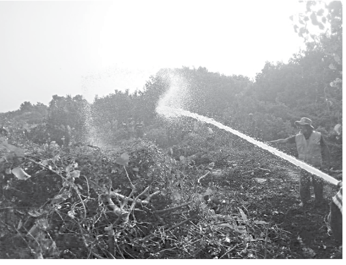
A forest fire being doused with water in the Sundarbans. Frequency of such manmade fires is on the rise in the world's largest mangrove forest.

According to the report of the committee, the primary causes of fire incidents in the Sundarbans include the use of flaming torches by honey collectors or by locals