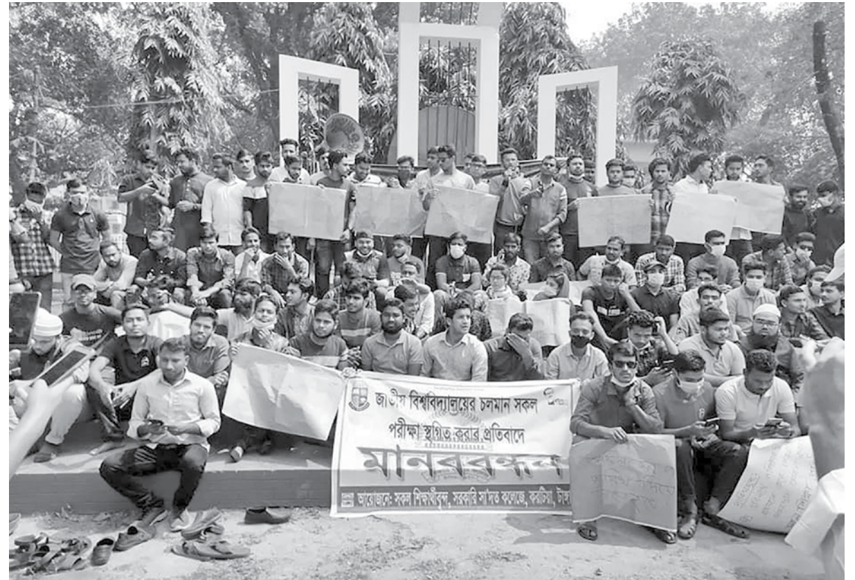
Students of Government Sadaat College in Tangail's Karatia stage a demonstration, followed by a human chain programme, at the institution's Shaheed Miner premises yesterday, protesting suspension of the ongoing examinations of National University.