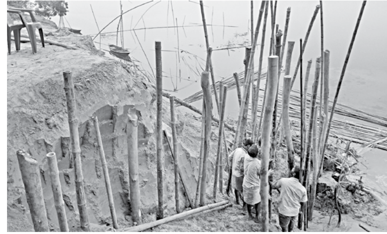
Villagers in Roumari upazila of Kurigram building structures on the bank of the Halhaliya river to protect themselves from erosion.

If the ten structures on the river bank are completed, erosion of Halhaliya can be prevented on a temporary basis, he said.