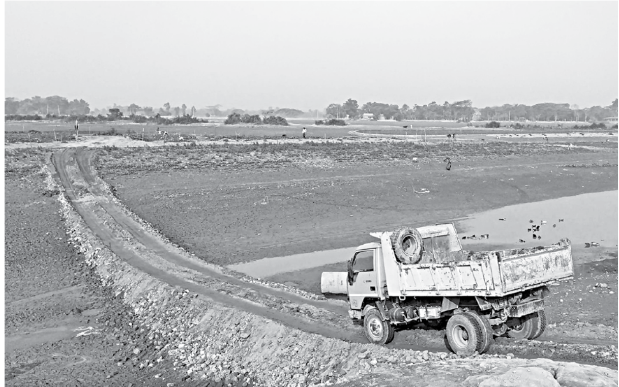
A truck driving down the road that was recently made by the owners of a brick kiln, across the Ubdakhali river in Kalmakanda upazila of Netrakona.