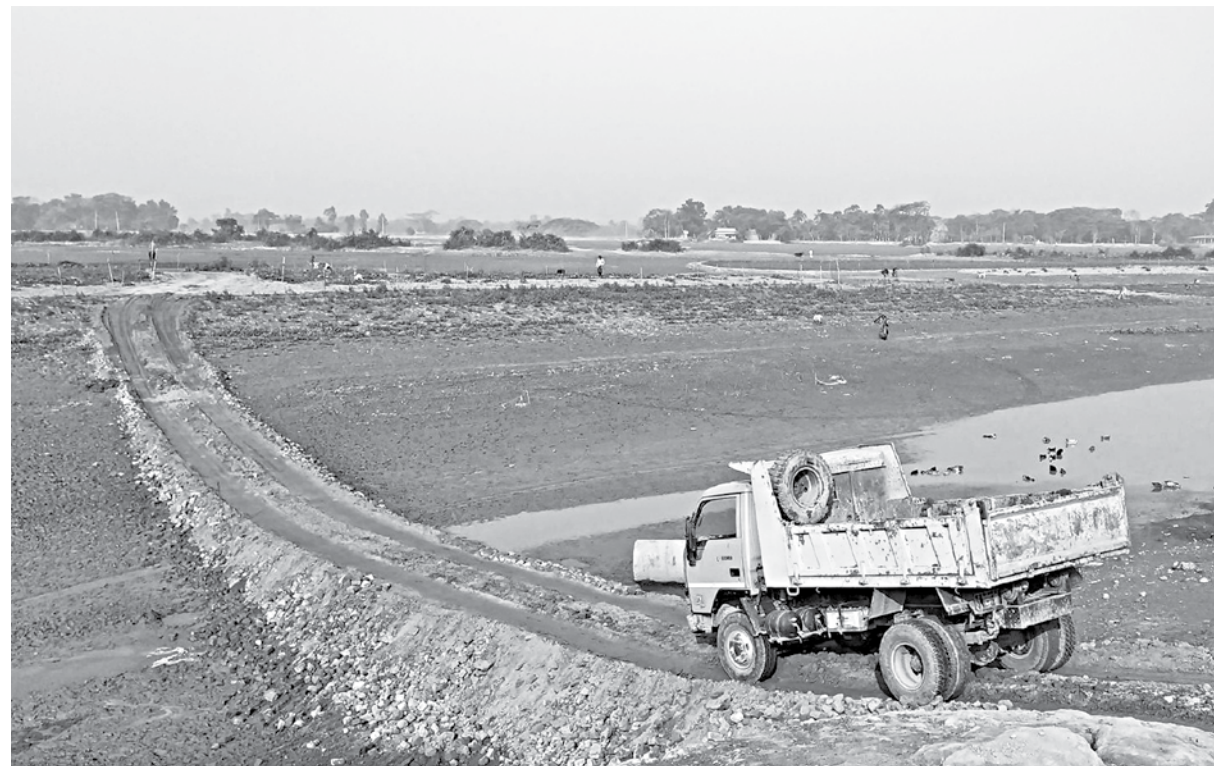
A truck driving down the road that was recently made by the owners of a brick kiln, across the Ubdakhali river in Kalmakanda upazila of Netrakona.