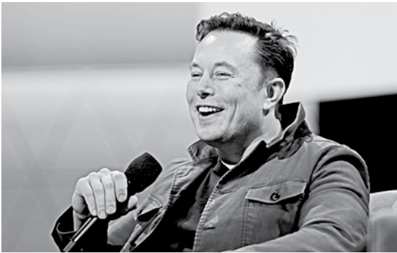
Tesla CEO Elon Musk speaks at the E3 gaming convention in Los Angeles, California.

Bitcoin, the world's most popular cryptocurrency, hit a fresh high in Asian trading on Saturday, extending a two-