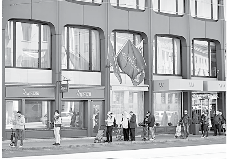
People line outside a supermarket during the coronavirus disease outbreak in Geneva, Switzerland.

After falling by 8.6 per cent in the first half of the year, Swiss GDP rebounded with a 7.2-per cent gain in the third quarter.