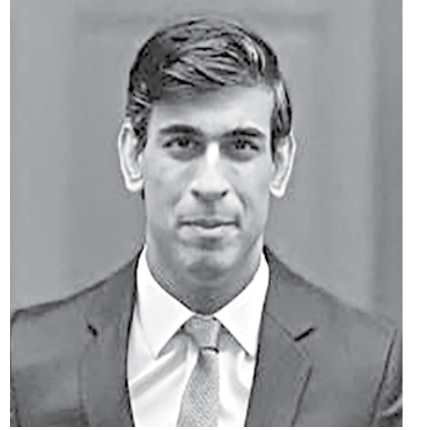
Britain's Chancellor of the Exchequer Rishi Sunak

Unlike the 2010 Conservative-led government, which pursued spending cuts to rebalance the economy after the global financial crisis, Sunak is expected to defer most of the toughest decisions about how to pay for that support in his budget speech.