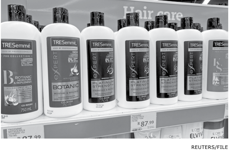
TRESemme products, a Unilever Plc brand, are seen on a shelf at a

Adjusted earnings per share for the year were 2.48 euros, one cent lower than analysts' estimates.