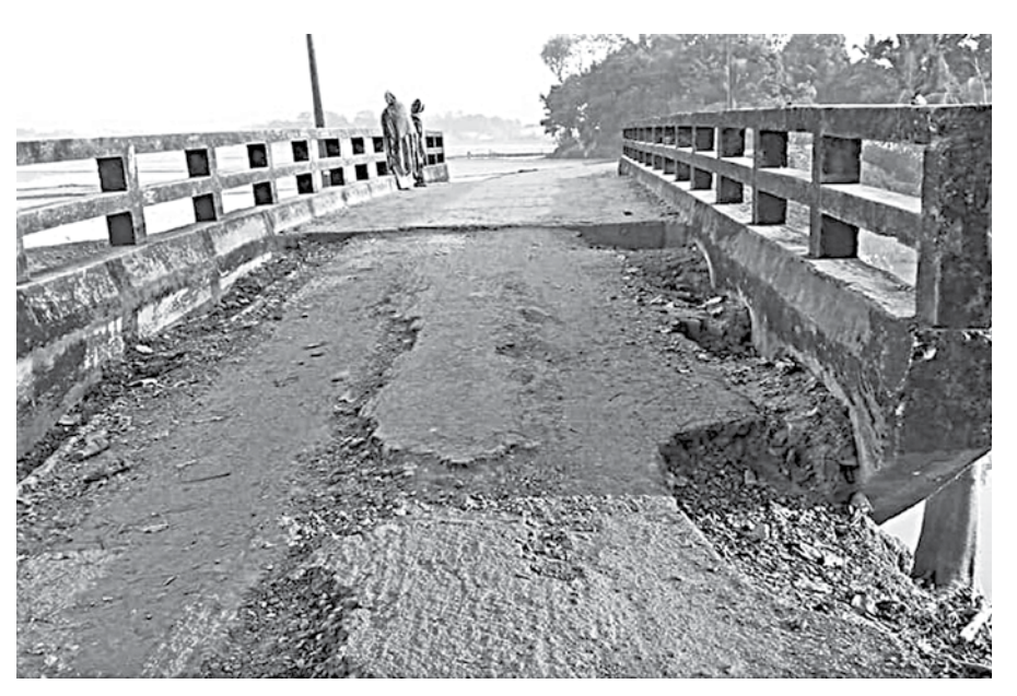
The Doariakona-Chandpur road in Netrakona's Kalmakanda upazila has been lying neglected for years.

The proposal is yet to be approved, the engineer added.