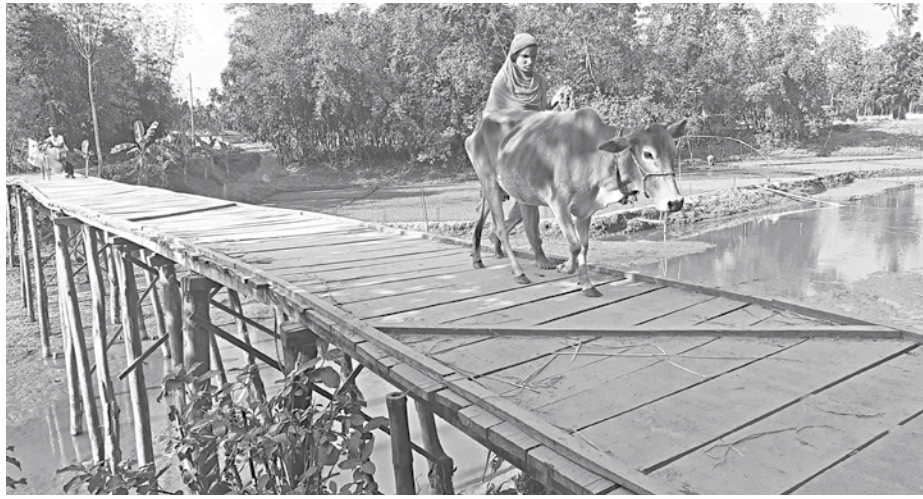
People at bordering Nakharjan village in Kurigram's Phulbari upazila cross the Nilkamal river on the shaky wooden bridge amid risk.