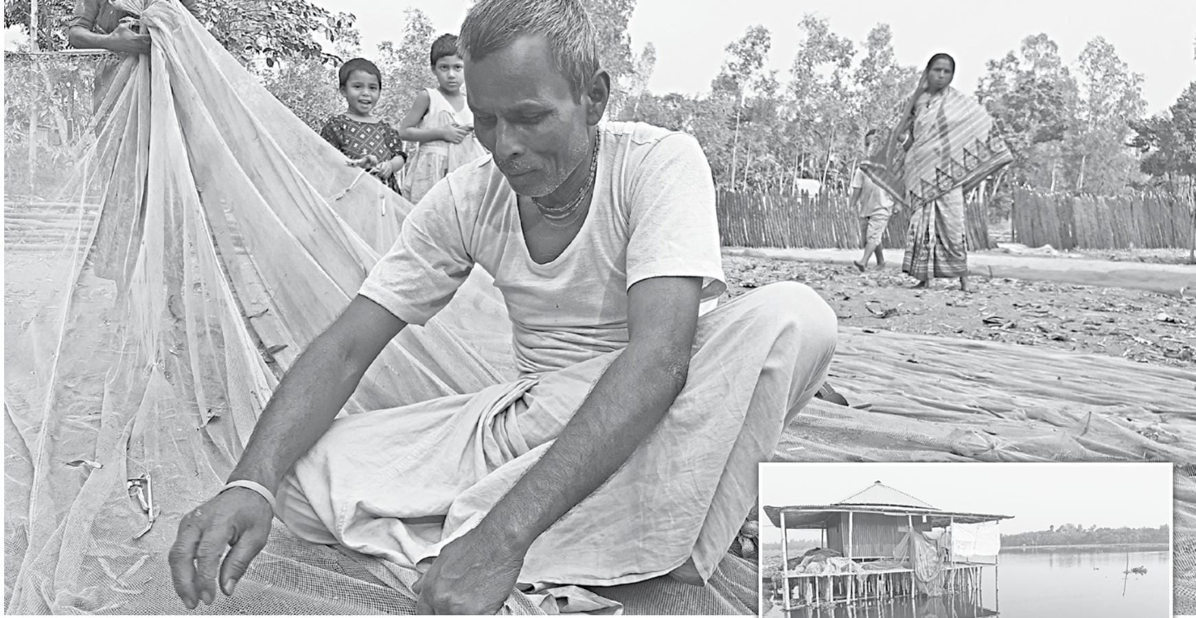
Fishermen are upset as the leasee of the Chakirpasha river in the Kurigram's Rajarhat upazila is not allowing them to catch fish in the river. Inset, the leasee has built a house in the river from where his men are patrolling the area.