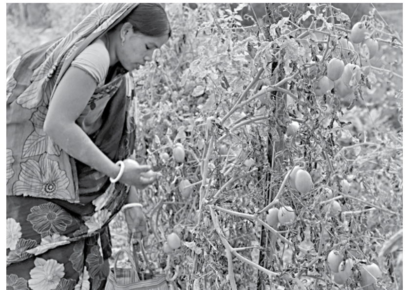
A farmer plucks tomatoes from a garden in Baniari village of Pirojpur's Nazirpur upazila. Despite a good harvest, winter vegetable farmers in the district are experiencing a massive fall in prices this season.

the production cost, let alone making profit, said Chinmoy Roy, another farmer from the same village.