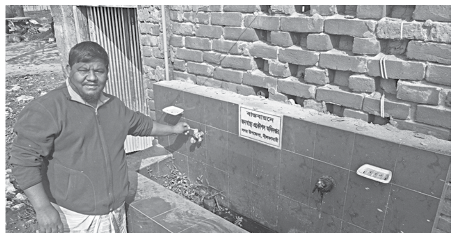
A hand wash basin, installed at Dhelapir haat near Saidpur municipality of Nilphamari, has been lying in a neglected condition for long due to lack of maintenance.

Nilphamari DPHE Executive Engineer Mokarram Hossain admitted that problems have been created in some basins, which would be repaired. They have manpower shortage to monitor the condition of all the basins round the clock.