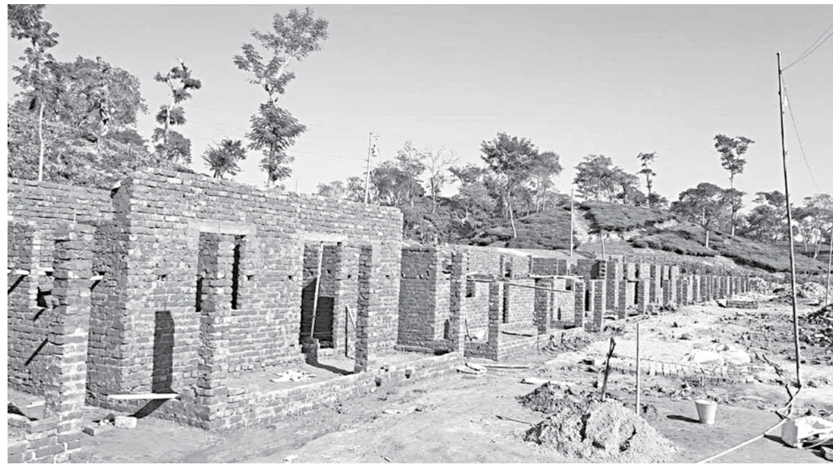
Houses for the homeless being built right at the bottom of slopes of hillocks, in Bishamani area of Srimangal upazila in Moulvibazar. The photo was taken recently.