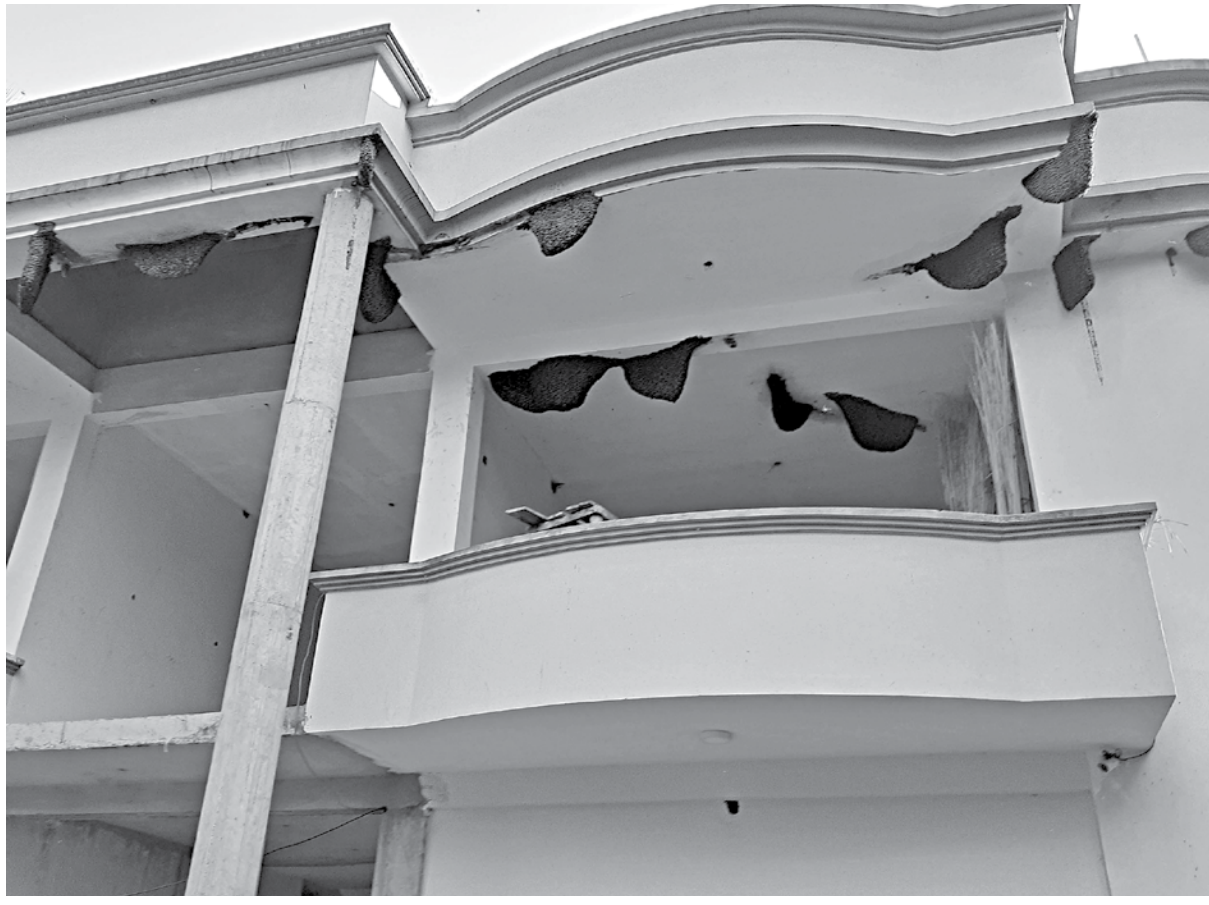
Several of the 40 beehives in the house, in Sadar upazila of Rajbari, which is drawing a good crowd every day. The photo was taken recently.