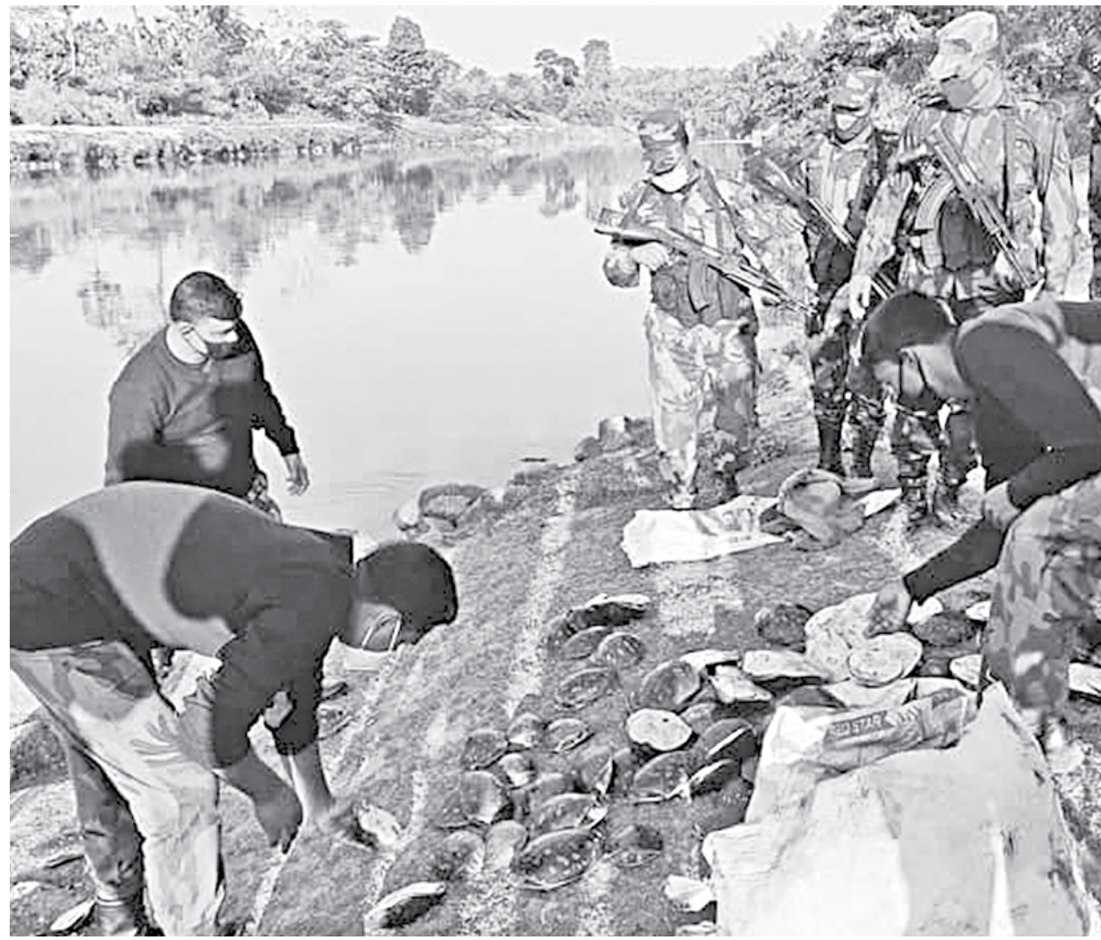
Members of Border Guard Bangladesh (BGB) rescued these tortoises from a Bariarihat-bound truck from Khagradhari on Saturday morning and later released those in the Feni river the same evening.