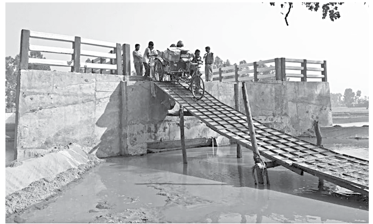
Due to lack of approach roads on both sides of the bridge over the Jinjiram river in Kurigram's Roumari upazila, people face untold sufferings.

The construction of the approach roads will be completed within the next two months, said the engineer.