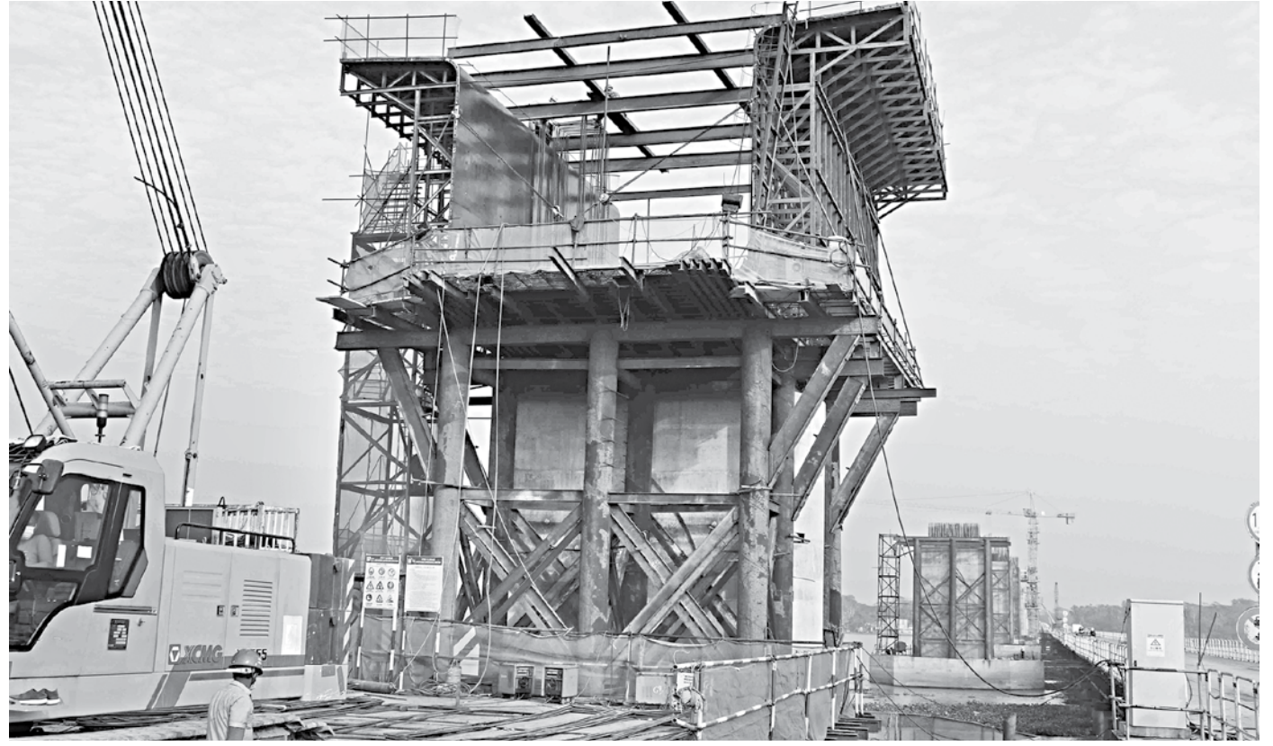
An under-construction pier of the Eighth Bangladesh-China Friendship Bridge, which was previously set to be open this month, over the Kacha river in Pirojpur. According to a newly set deadline, the Tk 822-crore bridge might get completed by June next year. The photo was taken recently.