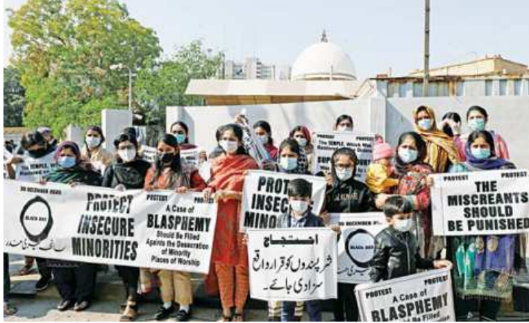
People from the Hindu community hold signs and banners to condemn the attack on a century-old Hindu temple in northwestern Pakistan, during a protest outside Supreme Court building in Karachi, Pakistan yesterday.

"Gulshan Abbas has been sentenced according to the law by Chinese judicial organs for taking part in organised terrorism, aiding terrorist activities and seriously disrupting social order," foreign ministry spokesman Wang Wenbin told reporters.